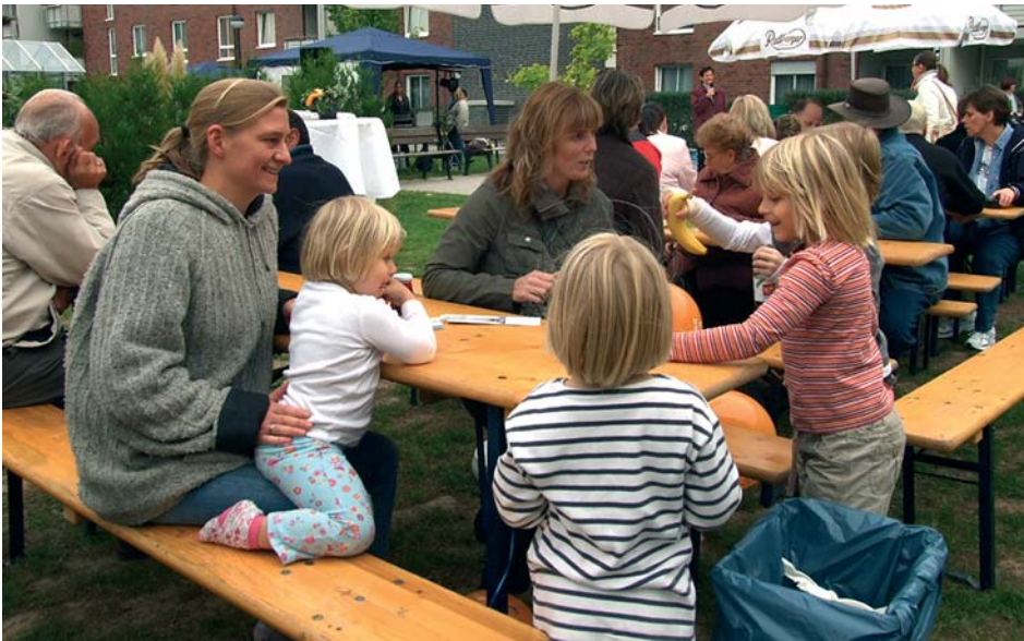
An langen Tischen war Gelegenheit, den Durst zu löschen und sich mit Obst, Kuchen oder Gegrilltem für die zahlreichen Spiele zu stärken.