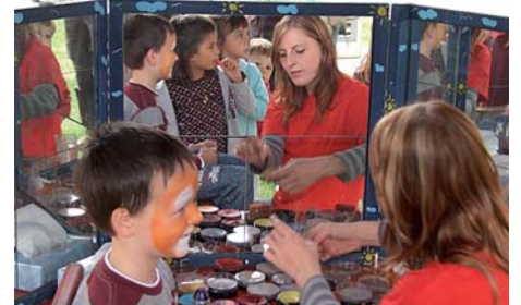
An den Schminkständen verwandelten sich Jungen und Mädchen in wenigen Minuten zu wilden Tieren.