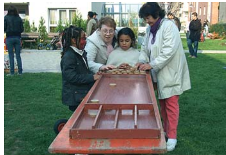
Ob Jung oder Alt höher punktet, wird sich noch zeigen.

Dass längst nicht immer die Erwachsenen am schnellsten sind oder die meisten Punkte einheimen, erwies sich an den großen Brettern mit Geschicklichkeitsspielen.