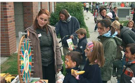
Frisches Obst in Bio-Qualität gab's am Tegut-Glücksrad zu gewinnen.

Anders als im Vorjahr kam das Kuchenbuffet diesmal von Tegut. Die in Deutschlands Mitte stark vertretene Kette eröffnet im November den lang erwarteten Supermarkt für das Viertel.