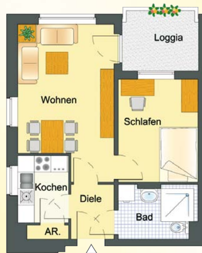
Beispiel: 1-Personen-Wohnung; 44,43 m 2 Grundmiete: 215,49 €

Die Vermietung erfolgt provisionsfrei durch den Eigentümer Sahle Wohnen.