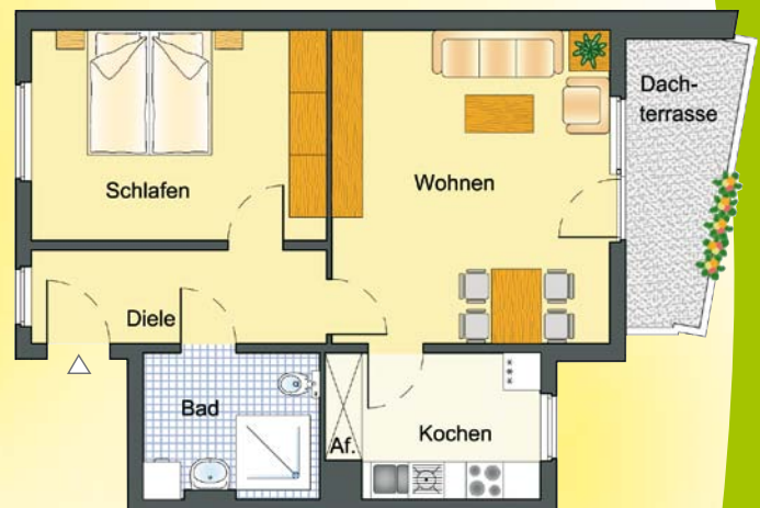
Beispiel: 2-Personen-Wohnung; 60,79 m 2 Grundmiete: 294,83 €