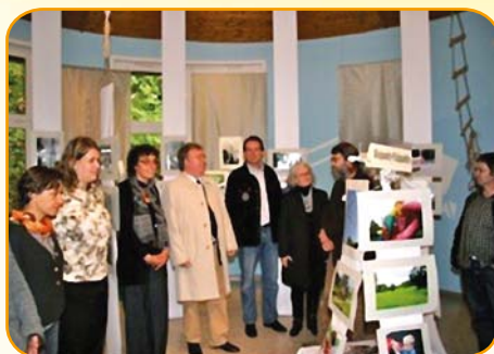
Bilder-Reise durchs Quartier: Die Fotoausstellung „Blickpunkte – Klickpunkte“ wurde von Bürgermeister Knut vom Bover (M.) eröffnet.

gelände auf Stelzen umherlief und dabei mit flinken Fingern viele hübsche Luftballontierchen für die Kleinsten zauberte, interessierten sich die erwachsenen Besucher vor allem für das spezielle Highlight des diesjährigen Stadtteilstests: die Fotoausstellung „Blickpunkte – Klickpunkte“, die im Mehrzweckraum des Hauses für Familien gezeigt wurde. „Wir hatten die Bewohner des Stadtteils gebeten, mit Fotos