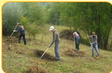
An die Harke, fertig, los: Bei den Aktionen der AGNU mischten die Jugendlichen aus dem Nachbarschaftstreff munter mit.

eigene Sorgen, Ängste oder auch mal Frust loswerden zu können. „Bei uns haben die Jungen immer auch die Möglichkeit, über die Dinge zu sprechen, die sie gerade beschäftigen. Das können Schulprobleme sein, aber auch Alltagsgeschichten“, sagt Lisovskij. Schon einige Male halfen die älteren Jugendlichen bei Aktionen der AGNU (Arbeitsgemeinschaft Natur und Umwelt Haan e.V.) mit, beispielsweise beim Zurückschneiden der Kopfweiden. In diesem Jahr nun sollen auch die Jüngeren die Möglichkeit erhalten,