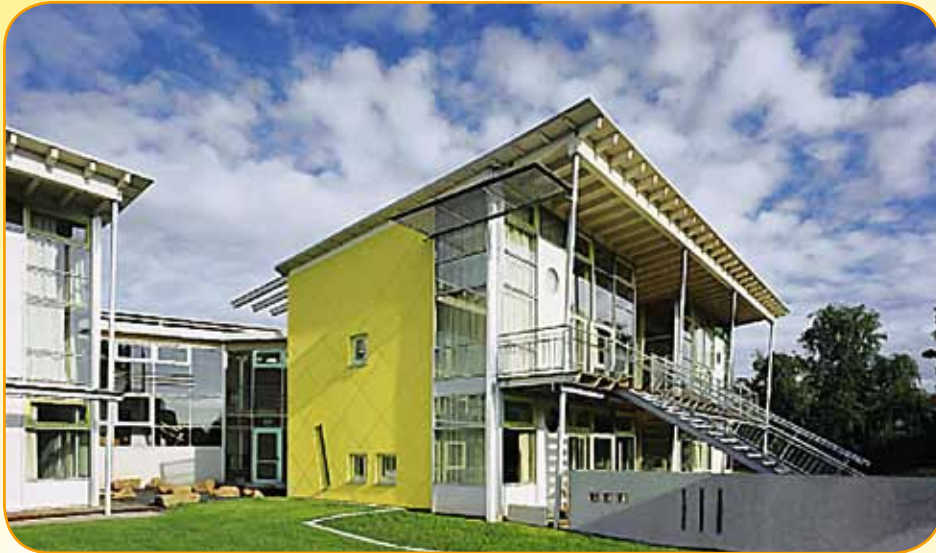
Schule als Lern-Oase: Schon vom Erscheinungsbild her kommt die Wartburg-Grundschule so gar nicht wie eine Schule im klassischen Sinne daher. In den insgesamt vier zweigeschossigen „Kinder-Häusern“ (Foto) sind jeweils vier Klassen untergebracht.