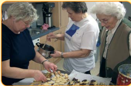
Gemeinsames Plätzchenbacken gehörte in der Adventszeit zu den gern gepflegten Aktivitäten im Nachbarschaftstreff.

Bereits Anfang 2009 stand für alle fest, dass es in dem Jahr wieder reichlich Feste geben sollte, bei deren Organisation übrigens alle gern mithelfen, soweit dies individuell möglich ist. Nach einem gelungenen Osterbrunch, Blumenfest und Sportfest war die Gemeinschaft bestens eingespielt, sodass ein typisch bayerisches Oktoberfest und verschiedene Angebote in der Weihnachtszeit ebenfalls mit großem Erfolg veranstaltet werden konnten. Aktivitäten und Feste sind zweifelsohne eine willkommene Abwechslung in der Nachbarschaft. Noch wichtiger aber ist, dass im Nachbarschaftstreff über die letzten zwei