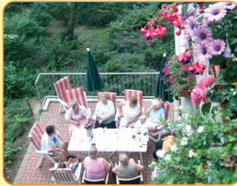
An warmen Sommertagen wird fürs Kaffeetrinken in geselliger Runde oft die Terrasse genutzt.

Saisonale Feste, Kaffeetrinken, Sport, Spielnachmittage und Ausflüge gehören inzwischen zum Standardrepertoire des Nachbarschaftstreffs. Darüber hinaus wurden im vergangenen Jahr verschiedene besondere Aktivitäten ins Leben gerufen. Im Spätsommer gab es beispielsweise einen Flohmarkt, der von einer Gruppe von Senioren selbst organisiert worden war. Über Wochen hatten die Mitglieder der Gruppe Keller durchforstet und bei Nachbarn nach gut erhaltenen und brauchbaren Gegenständen gefragt, um bei ihrer Veranstaltung ein möglichst breit gefächertes und attraktives Sortiment anbieten zu können. Der Flohmarkt fand auf der Terrasse vor dem Nachbarschaftstreff statt. Mit Kaffee und Kuchen war wie immer selbstverständlich auch für das leibliche Wohl der Besucher gesorgt. Die Arbeit und das Engagement der Senioren wurden belohnt: Zahlreiche Besucher aus der Wohnanlage und dem Viertel kamen vorbei, fast alles wurde verkauft. Ein Teil des