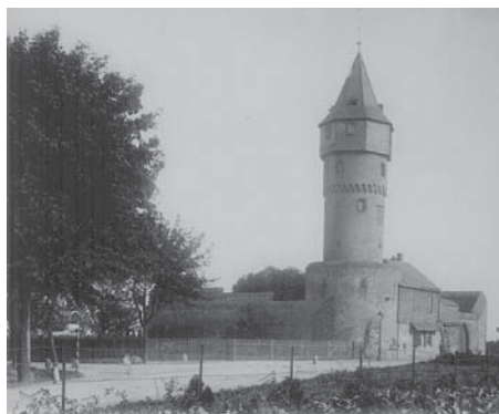
So beschaulich sah es vor gut 100 Jahren an der Warte aus. Diese Fotografie entstand 1902.

Zum Durchlass für den Verkehr auf den großen Landstraßen entstanden fünf Warten - Wachtürme, die mit ihren Höfen und hohen Mauern kleinen Burgen glichen. Sie boten Schutz vor Überfällen und dienten als Wohnung für die städtischen Beamten,