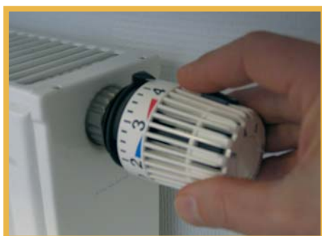
Kluges Heizen und Lüften hält das Klima in Ihren Räumen angenehm - und die Kosten im Zaum. Sahle Wohnen und die Verbraucherzentrale Hessen geben Tipps.