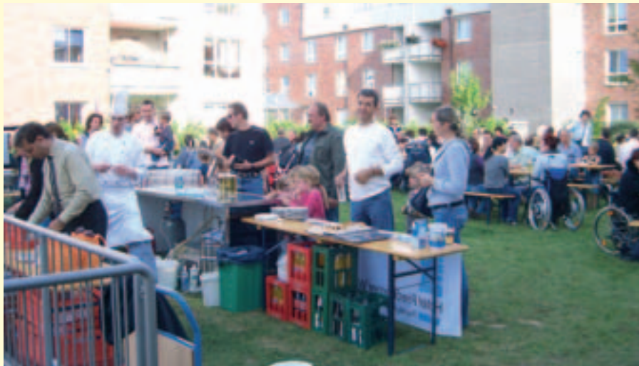
Die vom IB-Hotel aufgestellten Tische und Bänke reichten am späten Nachmittag nur knapp aus, um die vielen Festbesucher unterzubringen

Samstag, der 15. September. Es ist 14 Uhr. Nach vielen feucht-kühlen Tagen ist der Sommer zurückgekehrt – mit linden Lüften, einem strahlend blauen Himmel, auf den ein paar weiße Wolken getupft sind, und mit einer kräftig wärmenden Sonne.