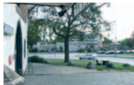
Wenn die Straße weicht, entsteht zwischen Friedberger Warte und dem Nahversorgungszentrum ein schöner Platz zum Flanieren.

angedeutet hat, wird schließlich Realität: Das Wohngebiet an der Warte wird - mit Eigenheimen, mit frei finanzierten und öffentlich geförderten Wohnungen - ein Zuhause für Menschen in allen Lebensphasen, von Singles über Familien bis zu Senioren.