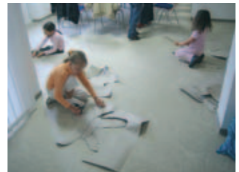
Nach dem Entwurf auf Malpapier folgt die Vergrößerung auf Pappe, anschließend das Zuschneiden der Schablonen.

Als dann nach gut zwei Stunden die letzten Bilder fertig sind, zieren Blumen, Tiere und Fahrzeuge in fröhlichen Farben die vorher schlicht grauen Betonflächen. Einhellige Meinung der jungen Künstler: Die Malaktion sollte auch im Wohngebiet auf der anderen Seite der Friedberger Landstraße wiederholt werden. Denn schließlich gibt es auch dort Tiefgaragenlüfter, die darauf warten, in sommerbunte Kunstwerke verwandelt zu werden.