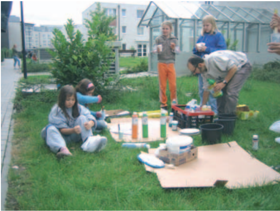
Bevor es ans Malen geht, müssen die passenden Farbtöne angemischt werden.