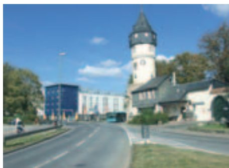
Demnächst rollt der Verkehr auch stadtauswärts zwischen IB-Hotel und der Warte.

Weise, so hoffen die Planer, wird sich hier auch in den Abendstunden das Stadtteilleben abspielen. Angestebt ist außerdem, einen wöchentlichen Markt auf dem Platz zu etablieren.