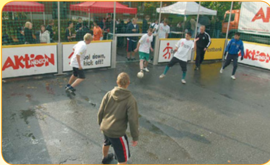
Der Parkplatz hinter dem Begegnungszentrum war Austragungsort für rasante Spiele, bei denen Fairness Vorrang hatte.