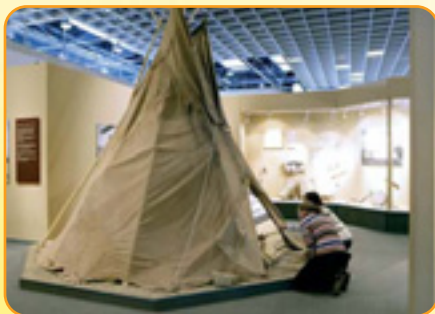
Ein echtes Tipi, in dem Indianer wohnten.

"Mit deren Hilfe entwickelten die Indianer neue Jagdmethoden, und es entstanden die wandernden Bisonjäger-Stämme." Spätere Siedler begannen, die Bisons auszurotten, um den Indianern ihre Nahrungsgrundlage zu entziehen. Was sich von der indianischen Kultur bis in unsere Tage erhalten hat, wird in der Ausstellung ebenfalls gezeigt.