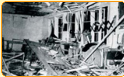
Der vollends zerstörte Besprechungsraum nach der Explosion der Bombe.

Diese war ursprünglich ein Plan der Wehrmacht, um einen möglichen Aufstand der Bevölkerung oder von Kriegsgefangenen zu unterbinden. Soldaten der Reserve-Einheiten sollten wichtige Punkte in den Städten besetzen und gegen Aufständische vorgehen. Die Auslösung durch das