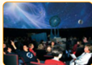
Bis zu 9.000 Sterne funkeln über den Betrachtern.