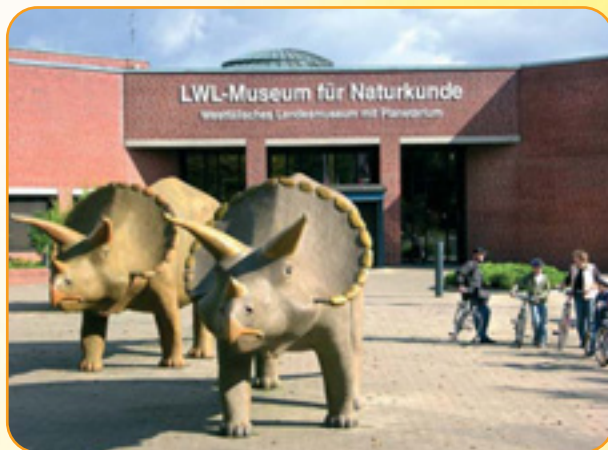
Zwei Nachbildungen des Triceratops empfangen die Besucher.

Unter einer 20 Meter weiten Kuppel geht die Reise wie für eine Raumschiff-Besatzung in drehbaren Ses-