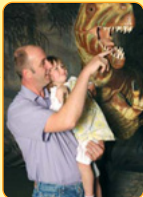
Vor diesem Gebiss muss sich niemand mehr fürchten.