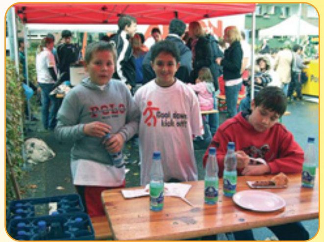
Pause zwischen zwei Spielen und Zeit, um sich zu stärken.