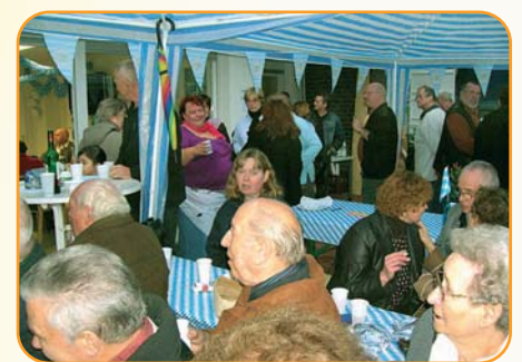
Zusammen leben - zusammen feiern: Zum Oktoberfest in der Wohnanlage „Am Nordpark“ kamen rund 200 Mieter.

Viel wurde an dem Samstagnachmittag geboten: Für die Kinder kam eigens das Spielmobil der Stadt Wuppertal mit seinen attraktiven Spiel- und Spaß-Angeboten vorbei. Zudem tummelten sich viele der Größeren und Kleineren auf dem Bolzplatz. Die Älteren vergnügten sich mit Tanz und Gesang bei der flotten Musik der Band „Die Nachbarn“, die von der Wohnanlage „Am Krautsberg“ herübergekommen war. Beim „Bayern-Quiz“ konnten zudem Preise gewonnen werden, die in der Größenordnung eines Wäschetrockners lagen – was sich zur Belustigung aller jedoch als Wäscheleine mit passenden Klammern herausstellte.