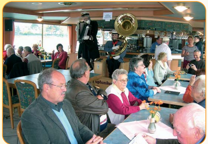
Eine Zwei-Mann-Kapelle aus lebensgroßen Figuren unterhielt die Mieter im Schiffssalon mit maritimen Weisen.

in seinen Räumlichkeiten begeisterte. Nach dem Mittagessen bestiegen einige bestens gestärkt zu Fuß den Drachenfels; die meisten wählten jedoch die bequemere Fahrt mit der berühmten Zahnradbahn zum Berggipfel. Dafür musste eigens ein Zusatzwagen für die vielen Besucher angekoppelt werden, denn der September gilt im Touristenort Königswinter eigentlich schon als Nebensaison, wie Kundenbetreuerin Bernhardine Franzen berichtet, die die Gruppe begleitete. Für die Mieter sollte das jedoch nicht von Nachteil sein. Im Gegenteil: Die