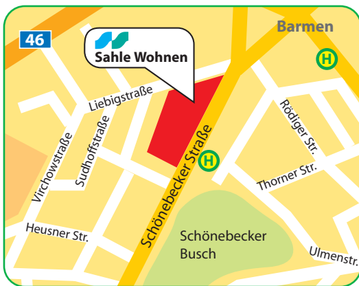
Stadtteil Barmen Paulinum An der Schönebecker