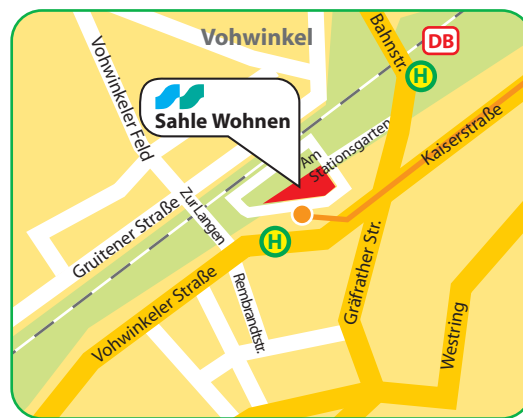
Stadtteil Vohwinkel Paulinum Am Stationsgarten