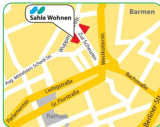
Stadtteil Barmen Paulinum Zur Scheuren